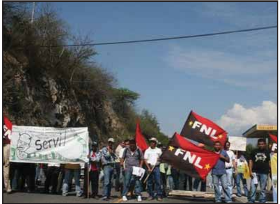
Bloqueo de carretera en Zacapa el 24 de febrero

en los hospitales del servicio público. Esto es un mensaje contradictorio pues por un lado aplica ciertos programas de asistencia social pero por el otro reduce el presupuesto necesario para la universalización de un servicio vital para el