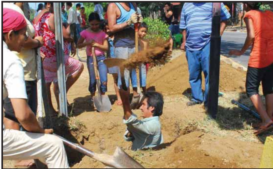
Pobladores de los barrios marginales de Managua rompen las tuberías en busca de agua

de las políticas neoliberales que Daniel Ortega ha venido implementando. Ningún gobierno que se proclame socialista va a reprimir a los trabajadores a como el Frente Sandinista lo ha hecho; ha utilizado un discurso demagogo y ha practicado la misma política que en los 16 años de gobiernos de derecha tanto critico en su oportunidad. El Partido Socialista Centroamericano (PSOCA) hace un llamado a toda la clase obrera y trabajadora a levantar su voz y exigir se les respeten sus derechos laborales y constitucionales; de igual forma hacemos un llamado al gobierno a resolver el problema de desabastecimiento de agua potable en los barrios, ya que es un derecho que todo ciudadano tiene y es deber del estado otorgar este vital líquido para la vida. ■