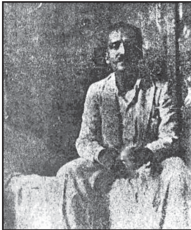
Farabundo Martí antes de ser fusilado