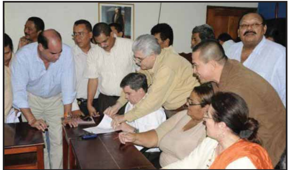
Los empresarios, el gobierno y la dirigencia sindical nuevamente se pusieron de acuerdo en un aumento miserable del salario mínimo