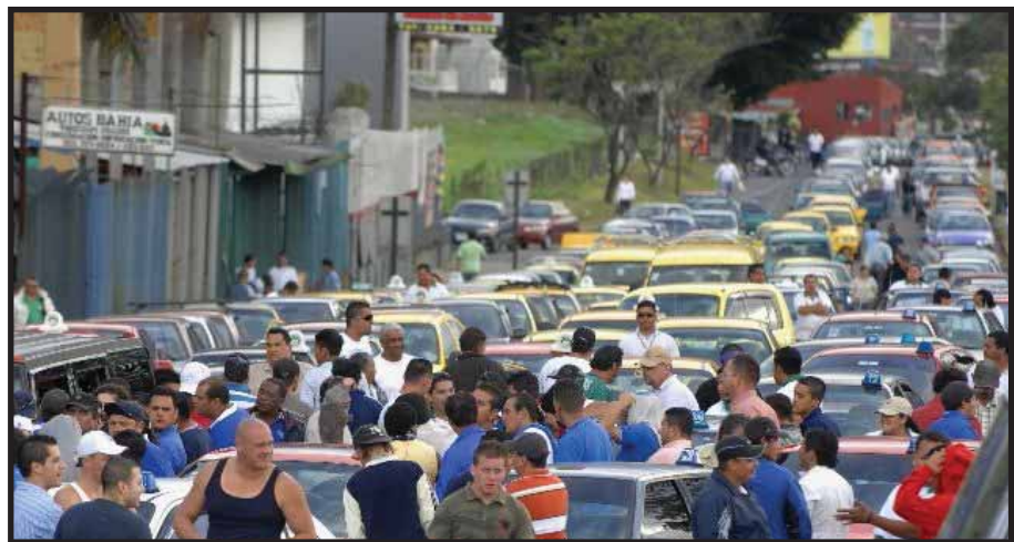
Las luchas populares, como la de los Porteadores, deben unirse a la lucha contra el Plan de Reforma Fiscal

La lucha de los porteadores es justa pero trágica porque se enfrenta contra otro sector de trabajadores que pasaron a la informalidad y que ahora son taxistas. Desde el Partido Socialista Centroamericano (PSOCA) llamamos a los trabajadores del sector informal, sean taxistas o porteadores, a