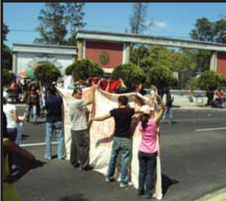
EL SALVADOR: Reforcemos la lucha por el ingreso a la UES

"Por la Reunificación Socialista de la Patria Centroamericana"