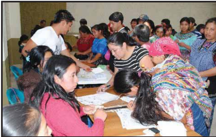
Consulta popular sobre minería en San Juan Ostuncalco

El 23 de febrero el gobierno presentó públicamente un proyecto de "Reglamento para el Proceso de Consulta del Convenio 169 de la Organización Internacional del Trabajo (OIT) Sobre Pueblos Indígenas y Tribales en Países Independientes". Bajo este larguísimo nombre el presidente Colom y sus ministros pretenden reglamentar