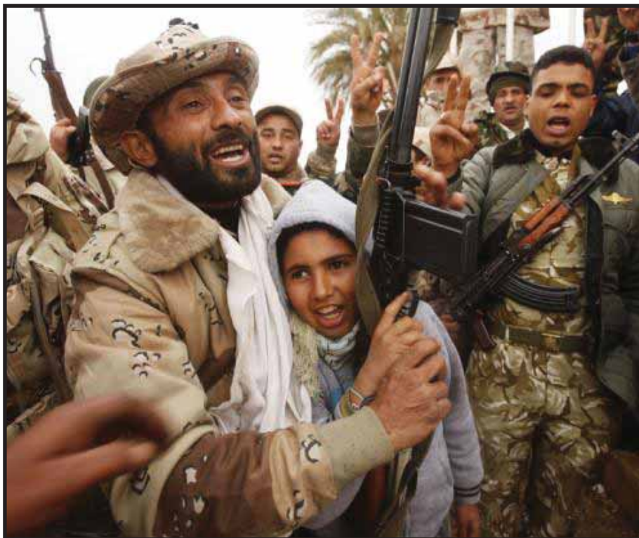
La insurrección popular y la guerra civil se extienden en Libia

del imperialismo, apoyamos sin reservas la lucha heroica del pueblo libio por conquistar las libertades políticas. Y en la guerra civil en curso, debemos apoyar