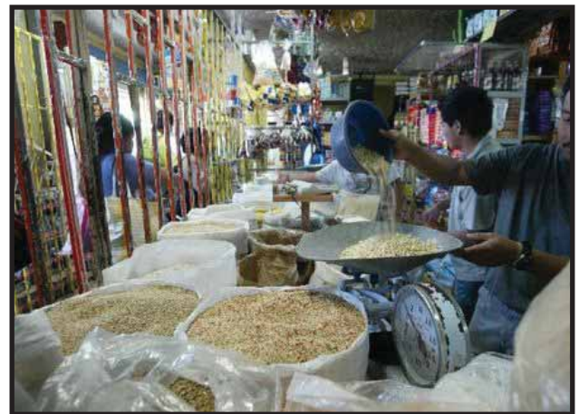
La crisis del capitalismo se refleja también en el alza del precio de los alimentos

Las últimas cifras mostradas recientemente por el Instituto Nacional de Estadísticas (INE), la Canasta Básica Vital (CBV) llegó a los 3,964.60 Quetzales aumentando con respecto a enero del año pasado en un 42.70 Quetzales, por su parte la Canasta Básica Alimentaria (CBA) reporto durante el mes de enero en 2 mil 172.60 y aumentando con relación a enero del año pasado en un 23.40 quetzales. Por su parte el salario mínimo decretado en