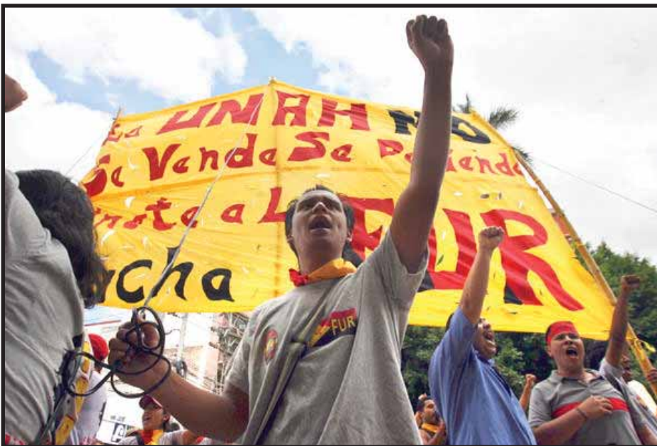
El FNRP debe encabezar todas las luchas económicas y sociales contra el gobierno de Pepe Lobo