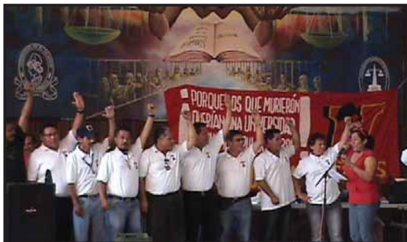
Nueva Junta Directiva del combativo SETUES

El PSOCA felicita a la nueva junta directiva del SETUES 2011-2012 y les llama a continuar trabajando en beneficio de la clase trabajadora de