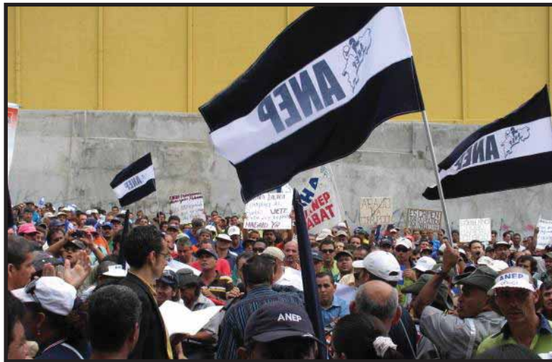
La unidad sindical y la movilización son claves para derrotar el Plan de Reforma Fiscal de Chinchilla

En oposición a esa medida de austeridad, varias centrales obreras y sindicatos entre las que podemos mencionar a la Asociación de Profesores de Segunda Enseñanza (APSE) , la Asociación Nacional de Educadores (ANDE) , la Asociación Nacional de Empleados Públicos y