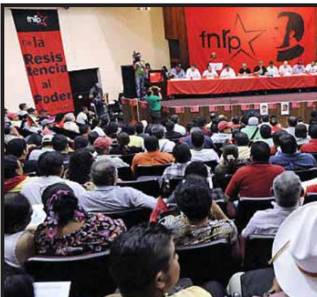
HONDURAS: Decisiva Asamblea Nacional del FNRP