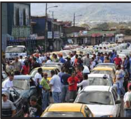
COSTA RICA: Chinchilla arremete nuevamente contra los trabajadores