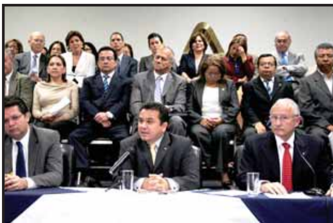
La plana mayor de los empresarios no quiere pagar mas impuestos

Que la clase trabajadora decida: más impuestos para los ricos